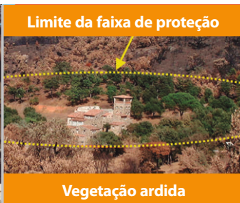
Limite da faixa de proteção