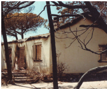
Abgebranntes Haus, umgeben von Vegetation, ohne Schutzzone.