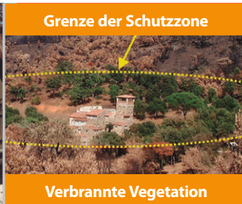
Haus mit Schutzzone, nicht vom Feuer betroffen.

NACH DEM 15. MÄRZ ERFOLGT DIE OBLIGATORISCHE KONTROLLE DER ANWESEN.