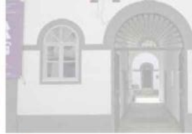
Casa Manuel Teixeira